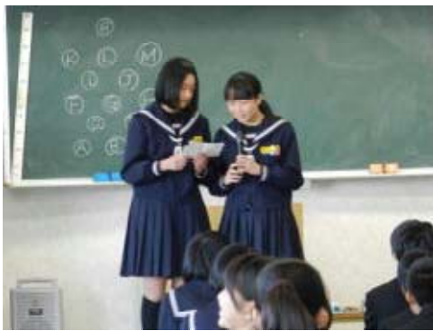
説明をしています ↑