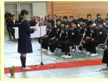
生徒代表歓迎の言葉