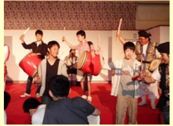
エイサー鑑賞・体験