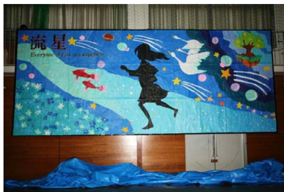
オープニング 全校壁画を披露！

文化祭には、お忙しい中にもかかわらず多くの保護者の皆さんや地域の方々に来ていただきました。ありがとうございました。ご覧いただき、いかがだったでしょうか。