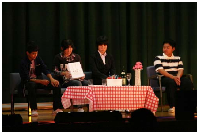
(上) 3年学年劇 “母さんに乾杯” (左上) 2年学年劇 “坊っちゃんモドキ2015” (左下) 1年学年劇 “素颜同盟”