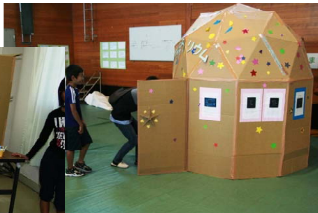
(上) 2年プラネタリウム (左上) 3年ピタゴラスイッチ (左中) 1年つまようじアート (左下) A組ゴジラ館