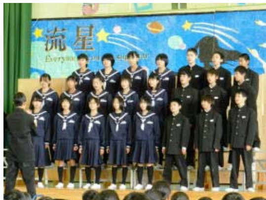
合唱祭を一気に盛り上げた1年2組

10月30日(金)午後、びわ中4大行事を締めくくる「合唱祭」を行いました。平日の午後にもかかわらず、多くの保護者の方、地域の方に参観いただきました。また、小中連携事業の一環としてびわ南小学校、びわ北小学校の6年生も参観に来てくれました。発表は1年→2年→3年の順に行いました。一番最初に歌ってくれた1年2組が、一番手というプレッシャーの中にもかかわらずしっかり歌ってくれ、一気に合唱祭を盛り上げてくれました。来ていただいた地域の人からは「これから1年生がどんなに成長してくれるか楽しみです。」との感想をいただきました。