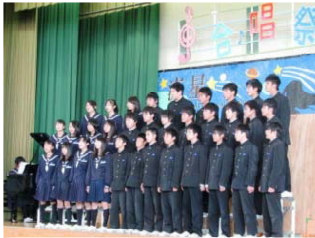
3年生・さすが堂々とした合唱

10月30日(金)午後、びわ中4大行事を締めくくる「合唱祭」を行いました。平日の午後にもかかわらず、多くの保護者の方、地域の方に参観いただきました。また、小中連携事業の一環としてびわ南小学校、びわ北小学校の6年生も参観に来てくれました。発表は1年→2年→3年の順に行いました。一番最初に歌ってくれた1年2組が、一番手というプレッシャーの中にもかかわらずしっかり歌ってくれ、一気に合唱祭を盛り上げてくれました。来ていただいた地域の人からは「これから1年生がどんなに成長してくれるか楽しみです。」との感想をいただきました。