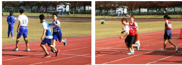
市民駅伝での力走↑

特にブロック駅伝では、女子チームが5位となり、久しぶりに県大会へ駒を進めることができました。県大会でも強豪ひしめく中ながら堂々とした走りを披露しました。