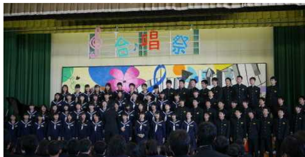
3年生による学年合唱「HEIWAの鐘」

特に3年生は、中学校生活最後の合唱祭ということもあり、思い入れの強さが伝わってきました。