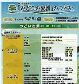
◀ 第29回全国「みどりの愛護」のつどい功労者表彰受賞