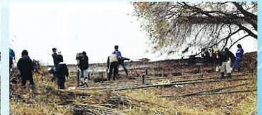
▲ 切り出しておいた竹を湖岸に固定