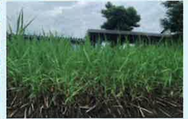
▲ 学校のヨシ育苗プールで育てた新芽