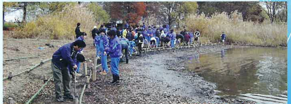
▲ ポット流出防止のための杭の打ち込み