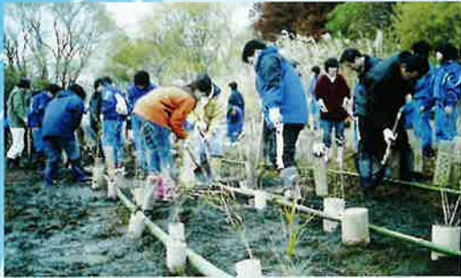
▲ たくましく育つように…願いを込めて