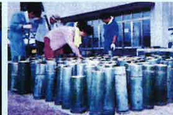
▲ 45cmの竹ポットを400本揃える