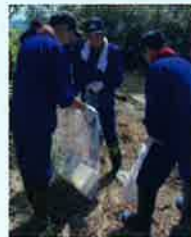
▲ まず湖岸のゴミ拾い