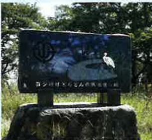
▲ 平成19年創立60周年に建立された記念碑