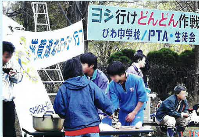
▲ 親子で行動し、ふれあいを深める