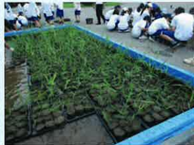
▲ 今年は1200株の新芽を切り取り移植