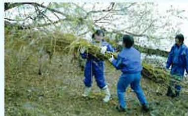
▲ ヨシ刈り…見た目より重いヨシの運搬