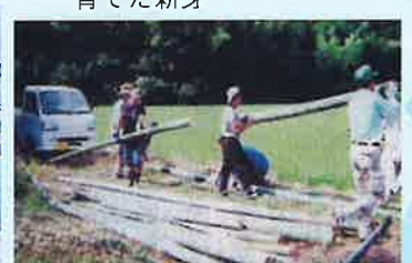
▲ 5月に伐採したポット用の50本の竹をトラックへ