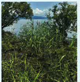
▲ 南浜湖岸に植栽した現在のヨシ群落