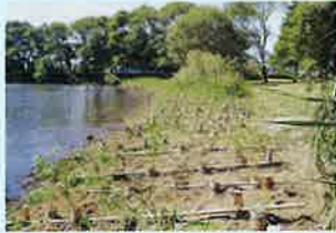
▲ 植栽1週間後のヨシ苗の様子